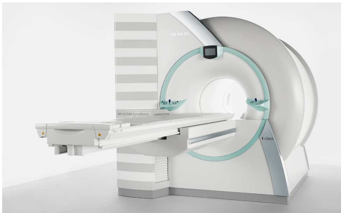
Figura 1 Risonanza Magnetica